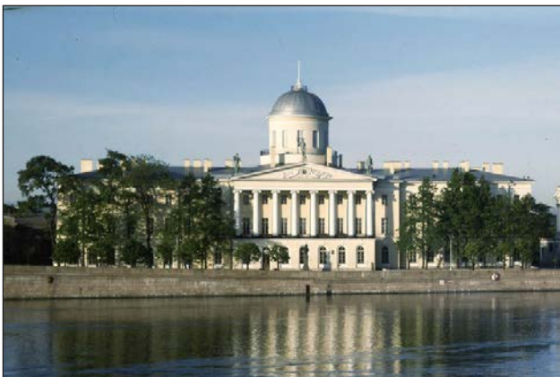
Рис. 2. Здание главной Морской таможни в Санкт-Петербурге