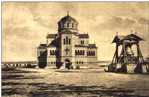
Рис. 4. Херсонесский собор на дореволюционной открытке

речь о «смуглых главах» Херсонесского храма. Но почему же она пишет о единственном куполе собора во множественном числе?